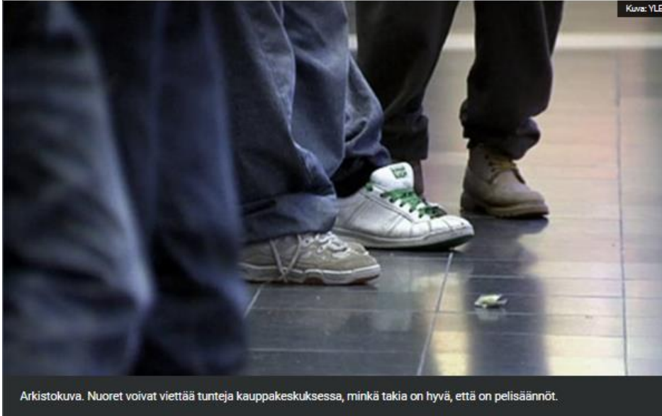
Arkistokuva. Nuoret voivat viettää tunteja kauppakeskuksessa, minkä takia on hyvä, että on pelisäännöt.

Tavaratalot & ostoskeskukset 16.5.2019 klo 13.56 | päivitetty 16.5.2019 klo 13.57